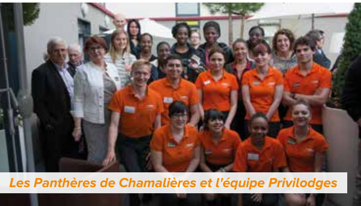
Les Panthères de Chamalières et l'équipe Privilodges

Chez Privilodges, la notion de service prend tout son sens. Privilodges Apparthôtels vous accueille et vous accompagne dans un univers apaisant et chaleureux, avec une équipe à votre écoute.